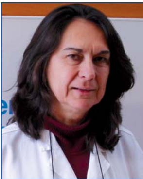
Jefe de Servicio de Medicina Interna Hospital de La Princesa